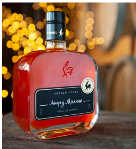
ラズベリーリキュール

コリアンダー、アーモンド、レモン、ジュニパーベリー、カモミール、ミント、ラベンダー、アンジェリカ、オレンジの皮、シナモンの10種類の香り高いハーブとシトラスを組み合わせ、蒸留したユニークな複合物から作られたジンです。