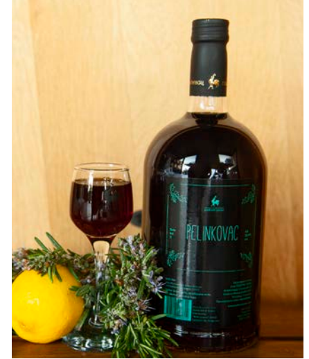
ビターリキュール

コリアンダー、アーモンド、レモン、ジュニパーベリー、カモミール、ミント、ラベンダー、アンジェリカ、オレンジピール、シナモンの10種類の芳香ハーブとシトラスを蒸留して作られたユニークなクラフトジンです。