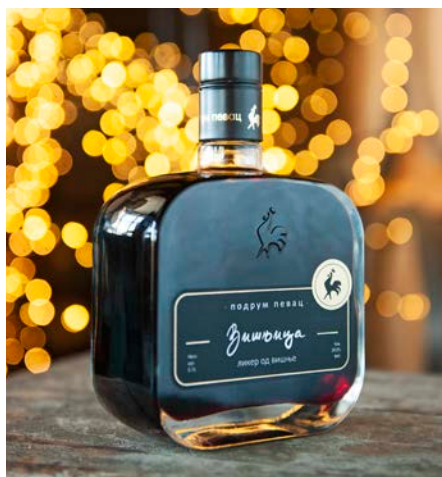
チェリーリキュール

古典的で伝統的なリキュール、クヌギとハチミツの共同製品である、勤勉なミツバチと私たちの成果です。クヌギと最高品質の花のハチミツの香りが調和した魅力的な組み合わせ、持続的で典型的な味わいで、簡単に魅了されます。リキュールはひまわりのハチミツを使用しています。