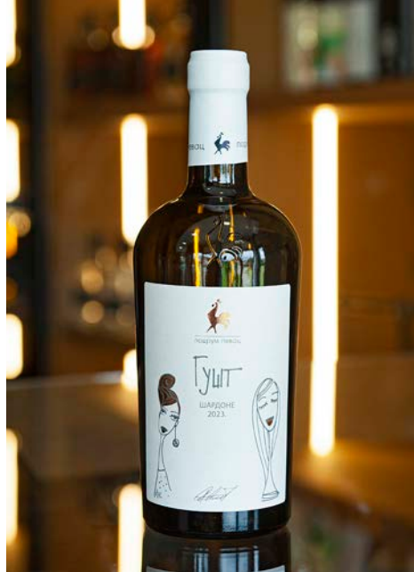
グシュト GUŠT アルコール度数:13.5% vol. シャルドネ(自社畑より厳選)

「グシュト GUŠT」という名にふさわしく、深みと滑らかな質感が五感を優しく刺激し、ゆったりと楽しむひとときを誘います。