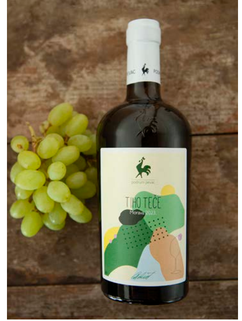
ティホ・テチェ TIHO TEČE アルコール度数:12.5% vol. モラヴァ種(シュマディヤ中心部の選定畑より)

グリーンがかった淡いイエローの外観。花やスパイスの繊細な香りや抜群のフレッシュさが特徴。上品で調和の取れた味わいが、穏やかな余韻へと導きます。