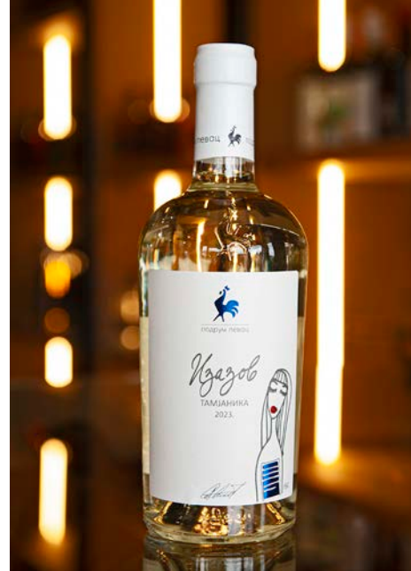
ザゾフ ZAZOV アルコール度数:12.0% vol. タミヤニカ種

華やかで生き生きとした香り、長く続く余韻。伝統と個性、そしてスピリットを象徴する1本です。