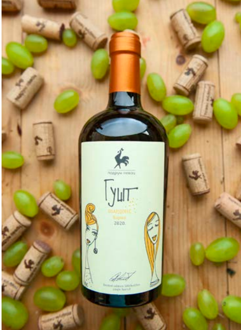
グシュト・バリック GUŠT Barik アルコール度数:13.5% vol. シャルドネ種(自社畑)|新樽発酵|シュール・リー製法|10か月熟成

力強くクリーミーな口当たりと長い余韻、トーストやアーモンド、バニラの複雑な風味が魅力の一本。