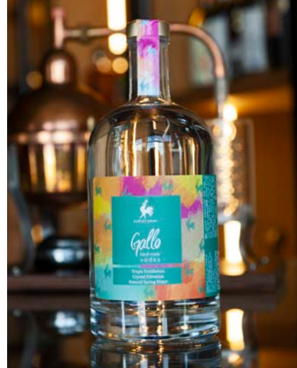
ハンドメイド・ウォッカ

厳選された熟成プラム・ラキヤと最高品質のグレープ・ブランデーをブレンドした、ユニークなクラフトスピリッツです。私たちの地域の薬草を丁寧にマセレーションし、熟成させました。ハーバルな香りが特徴で、調和の取れた味わいと心地よいバランス、そして抗いがたい魅力を持っています。 1リットルボトルでお届けします。