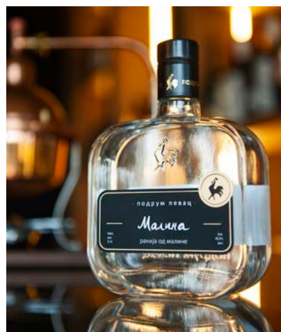
ラズベラ・ラキヤ

熟したチェリーの魅力的なコンポジション、バランスの取れた酸味、そして軽いアーモンド風味のフィニッシュ。爽やかで挑戦的な味わい。リキュールはひまわりのハチミツを使用しています。