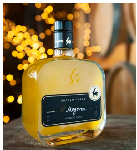
クヌギのリキュール

古典的で伝統的なリキュール、クヌギとハチミツの共同製品である、勤勉なミツバチと私たちの成果です。クヌギと最高品質の花のハチミツの香りが調和した魅力的な組み合わせ、持続的で典型的な味わいで、簡単に魅了されます。リキュールはひまわりのハチミツを使用しています。