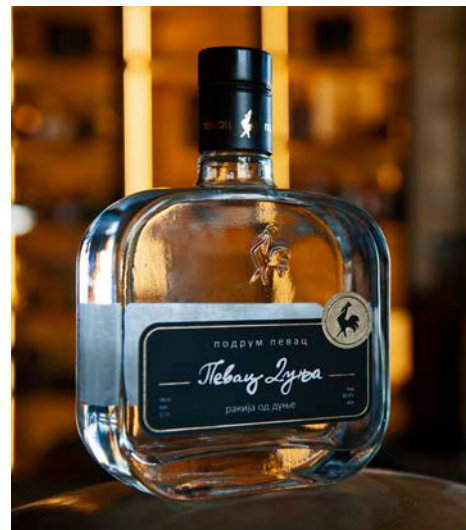
マルメロのラキヤ

私たちの製造における挑戦のひとつ。厳選されたアンズの果実を使用し、管理された環境で丁寧かつ長時間にわたる蒸留によって生み出されました。繊細でほのかに感じられるバニラのニュアンスがあり、これは古いオークバリック樽での部分的